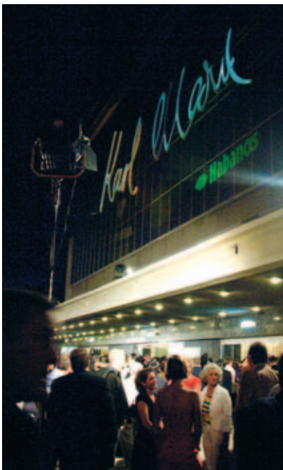
Das Teatro „Karl Marx“ – Kulisse für die „Noche de Bienvenida“

Die letzte Woche im Februar ist für Habanos-Liebhaber aus aller Welt ein fester Termin. Denn seit 1999 lädt die cubanische Hauptstadt jedes Jahr Aficionados zum „Festival del Habano“ ein. In diesem Jahr traf man sich vom 26. Februar bis 2. März 2007 zu diesem von Habanos S.A. veranstalteten Fest der Sinne und Genüsse.