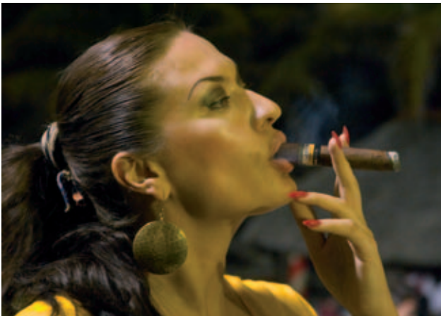
Der Genuss einer Cohiba Maduro 5

Die letzte Woche im Februar ist für Habanos-Liebhaber aus aller Welt ein fester Termin. Denn seit 1999 lädt die cubanische Hauptstadt jedes Jahr Aficionados zum „Festival del Habano“ ein. In diesem Jahr traf man sich vom 26. Februar bis 2. März 2007 zu diesem von Habanos S.A. veranstalteten Fest der Sinne und Genüsse.