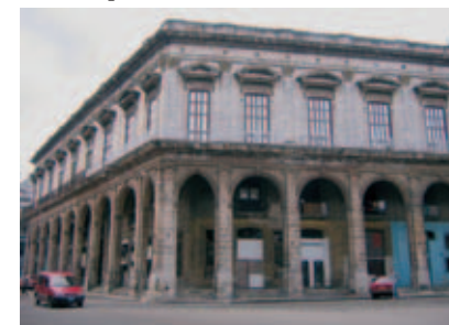
Palacio Villalba (4)