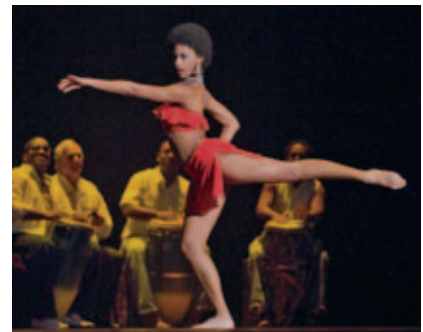
Sinnlichkeit – Hier eine Hommage an die Marke „Hoyo de Monterrey“

Beim Gala-Dinner erwartete die Gäste deshalb eine ganz besondere Spezialität: die Montecristo No. 4 Reserva. Damit möchte Habanos S.A. die Montecristo No. 4, diese mit über einer Milliarde mal meistverkauften Habano in der Cigarrengeschichte, würdigen.