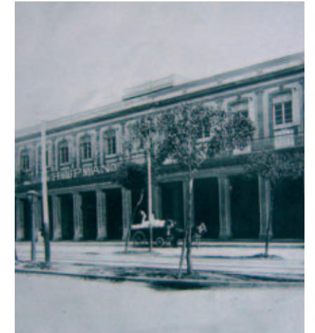
H.Upmann – Manufaktur

Havannas niedergerissen, die inzwischen mitten durch die Stadt verlief. Dies schaffte Neuland in sehr guter Innenstadtlage. Es bot Platz für Cigarren-Paläste, die die gut verdienenden Cigarrenhersteller bauen wollten. Es handelte sich tatsächlich um palastähnliche Gebäude, die damit auch den ökonomischen Erfolg der Habano weltweit widerspiegeln. Diese Gebäude entstanden fast alle in der Zeit um das Jahr 1880. Sicherlich sind diese Paläste auch ein Ausdruck des Konkurrenzkampfes, den sich die verschiedenen Cigarrenproduzenten untereinander lieferten. Die Paläste konnten schöner, größer und eindrucksvoller nicht sein. Zu diesen auch heute noch existierenden Gebäuden zählen „La Escepcion“ von José Gener (Foto), „La Meridiana“ (Foto), „Calixto Lopez“ (Foto), der „Palacio Villalba“, den José Suárez Murias, Inhaber der gleichnamigen