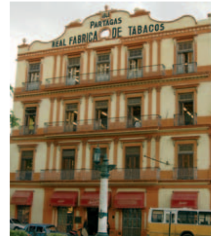
Partagás – Manufaktur (6)

Im Jahre 1863 wurden laut eines königlichen Beschlusses Teile der Stadtmauer