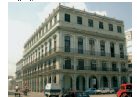
La Escepcion (3)