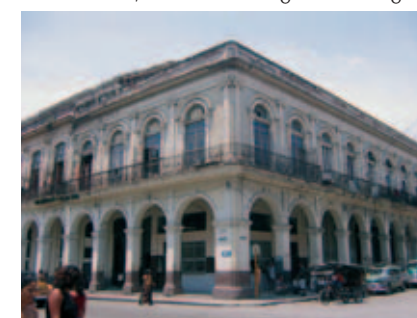
La Meridiana (2)