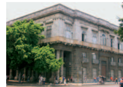
Palacio Aldama (5)